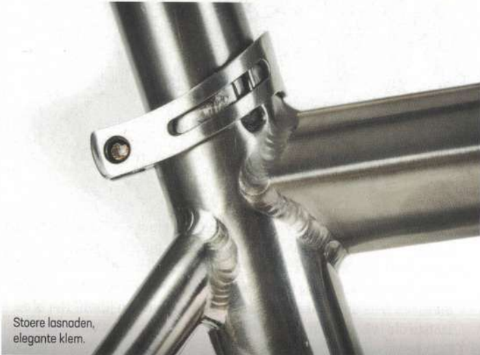
Stoere lasnaden, elegante klem.